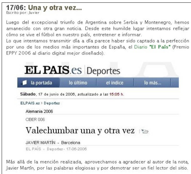
Figura 7. Simbiosis 5- Intercambio de links entre Vale Chumbar y El País da Espanha (17-06-06).