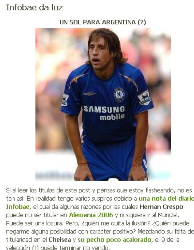
Figura 3. Simbiosis 1- Link de Vale Chumbar para Infobae (29-05-06).